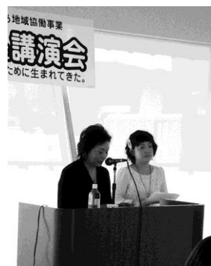
主催者と理事挨拶

また、生まれたばかりの赤ちゃんにも感情があり、帝王切開で生まれた子が「いきなりナイフが刺さって、足をつかまれてびっくりした」と生まれた時のことを数年たってから話しているテープを聞き、すでに母親となっている参加者たちからはざわめきが起こった。