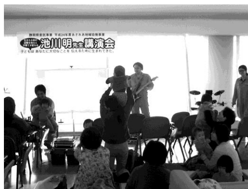
遊び歌に合わせて赤ちゃんジャンプ

コンソメ W パンチは、大学時代のサークル仲間が大学卒業後もバンドを継続、県内各地で親子向けのコンサート活動をしている。今回リーダーは2児の父親となり、自身の体験も語りながら、楽しい遊び歌や自作の歌を披露した。