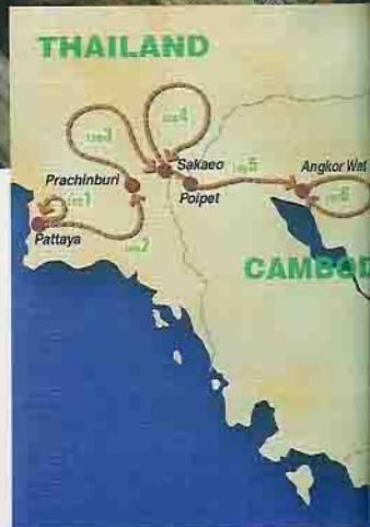
Die Route durch Thailand und Kambodscha mit sechs Abschnitten

war doch was? Bis etwa 1970 wohlhabend und als Schweiz Südostasiens tituliert, wurde das Land unter den Roten Khmer dann in die Steinzeit zurückgeschossen. Die vietnamesischen Besatzer ist das Land zwar los, die Armut nicht. Menschenrechtsorganisationen sprechen von viel Korruption und wenig Meinungsfreiheit. Zumindest wirtschaftlich tut sich etwas, seit Kambodscha im vergangenen Jahrzehnt