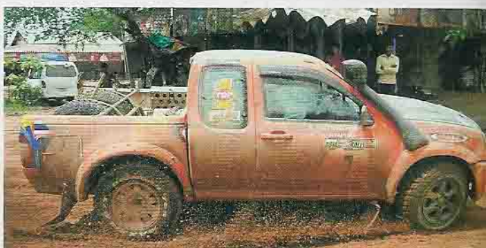
Die Verrückten in den Schnorchel-Pickups bringen Abwechslung ins Dorfleben