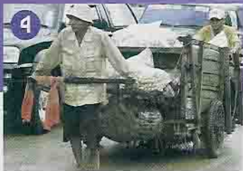
Momentaufnahmen am Rande des Weges: 1 Das Moped ist hier noch immer das beliebteste Transportmittel 2 Kinder freuen sich über die Aufkleber der Rallye 3 Mit dem Einachsschlepper auf dem Weg zur Feldarbeit 4 Schwer beladener Handkarren an der Grenze zu Kambodscha 5 Schwein gehabt! 6 Nicht Knast, sondern Lkw-Transport