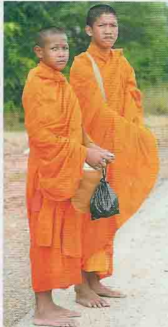
Die kambodschanischen Mönche schauen zu, wirken aber skeptisch