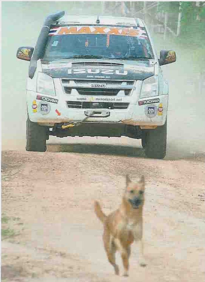
Lauf um dein Leben, Bello! Die Asia Cross Country Rally ist politisch in etwa so korrekt wie frühe Ausgaben der Rallye Dakar – also überhaupt nicht!

Noch wilder wird die erste Dschungelpiste, der die Rennleitung die Warnung „Passt auf die wilden Elefanten auf!“ vorausschickt. Das Ziel, das Mermaid Hotel in Sa Kaeo, erreichen aber sämtliche Besatzungen ohne Dickhäuter auf dem Schoß.