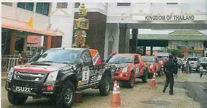
Heimspiel: Isuzu-Flotte am Grenzübergang von Thailand nach Kambodscha