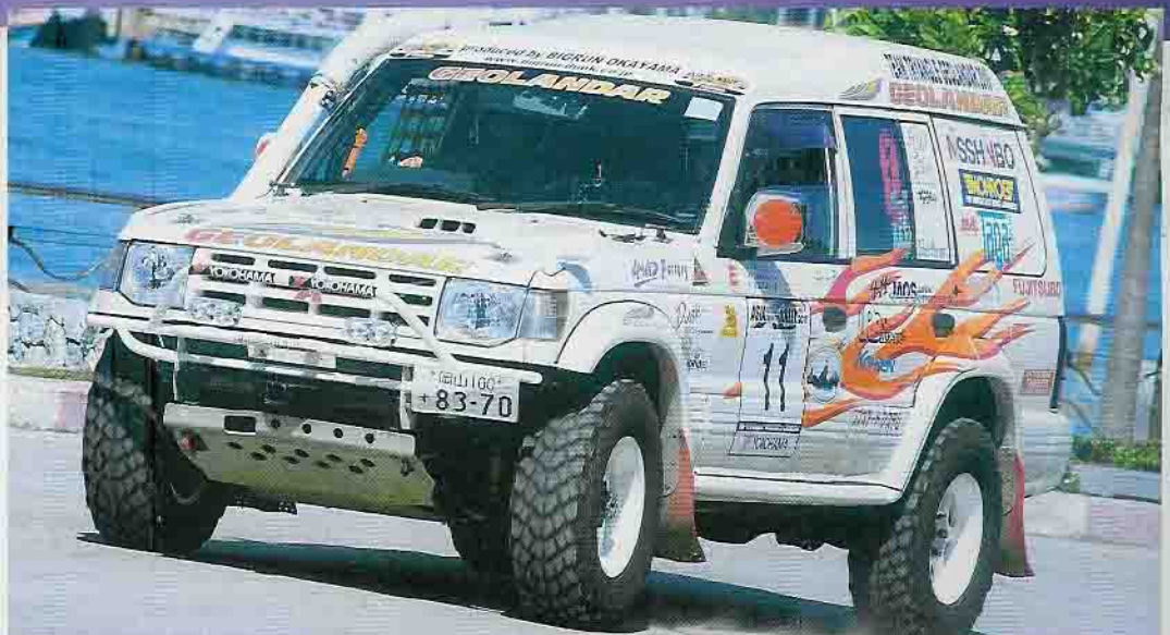
Pajero der V20-Baureihe am Pattaya Beach in Thailand, auf dem Weg zur Sonderprüfung. So sauber bleibt er nicht