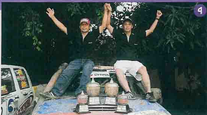
Fotos von unterwegs: 1 Skulptur vor dem Tempel Angkor Wat, dem größten Sakralbau der Welt 2 Zweisprachige Kreisverkehre, das Lesen kostet Zeit 3 Kambodschanische Tänzerinnen bei der Abschlussfeier 4 Siegeream Bunchuayluea/Noichard aus Thailand auf Isuzu D-Max 5 Start mitten im Nachtleben von Pattaya/Thailand